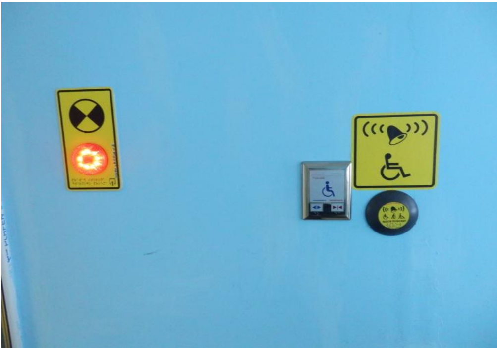
Кнопка вызова помощника, кнопка открывания дверей, световой маяк