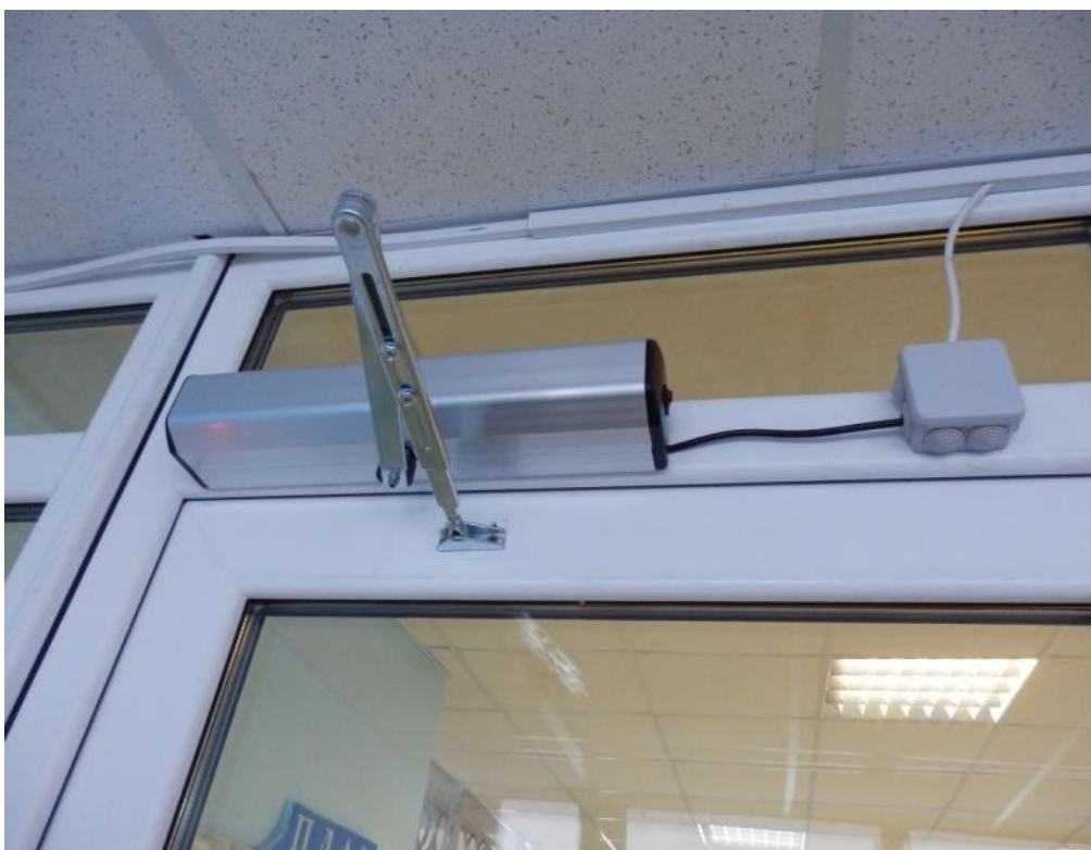
Автоматическое устройство открывания дверей