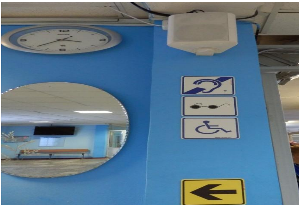
Звуковой маяк «Парус», информационные знаки